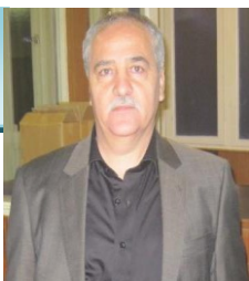
نیشاره به کۆمه ئیکيان

نیشاره به کۆمه ئیکيان دەکەم ، ، ناکراى و ناگونجى ناوی تاک به تاکى ئەو پيشمه‌رگه و به‌پرسانه‌ی له قەلای خەبات بوون ئیرەدا ناویان بیری ، ئەوش به معنای ئەو نیشیبه که ئەوانیکه هه‌یجان نەکردوو، بەلام هەر ئەوئنده دەتیم که ریز و خوشەویستیم هه‌یه بۆ هه‌مووان و دەبى لیم نەکووت. مریشکێکیان کوشت و له دوو شوینەوه شیلانگی ناوی مقەرەکه قرتابو. قەلای خەبات له ماوی ئەو چەند ساڵەدا له لایەن پۆلیسک پيشمه‌رگه که خەدمەتی چەکه قورسەکان بوون وه‌یزى به‌رگري گەلانەوه دەپارێزرا . پيشمه‌رگه‌کانى سازمانى خەبات له هه‌موو ناوچه‌كانى كوردستان له چالاکى سياسى و نيزاميدا بوون، بۆيه سازمان ناسایشى قەلای خەباتی بەژمارەیک هیزی پيشمه‌رگه‌و هه‌روه‌ها هیزی به‌رگري سپاردبوو. ئەو سەردەمەدا سازمان به سەدان کەس هیزی به‌رگري هه‌بوو که پشیتیوانی برايشمه‌رگه‌کانیان بوون له هه‌موو کات و ساتیکدا ، زۆرله هیزه‌کانی به‌رگري به مانگ له بنگه‌و بارگاکانى قەلای خەباتدا خزمەتیان دەکرد ، سازمان بۆ ئەوی کەس خەدری ئینەکه‌رئ، به‌رنامه‌یه‌کی باشی بۆ دانابوون که هەر پانزه پۆزه‌وه هیزی به‌رگري شۆینەکه‌یانەوه مالی به‌ریز مامۆستا شیخ جەلال گواستیایانەوه بۆ هەرسێ خەبات، به‌نگه‌ یا مقەری کانی مامەر دهناسرا . دواجار به‌ هۆی بچووکی شۆینەکه‌یانەوه مالی به‌ریز مامۆستا شیخ جەلال گواستیایانەوه بۆ هەرسێ خەبات، به‌نگه‌ بـوو له قەلای خەبات ، کاک بابەشیخ حسینى ئەوکات راننده‌ی ماشینیکی باره‌لگری سازمان بـوو که کار و به‌رگري هه‌بوو. که به راستی پشیتیوانیکی باش بوون بۆ هیزی پيشمه‌رگه، زۆر جاربۆ به‌رگکانی شهر دێر. ئەوانه‌ی له قەلای خەبات و دەوربه‌ری ده‌زان چ کهسانیک بوون ؟